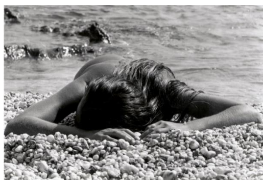
Trésor – Photo Bernard Pesce

Les membres de l'équipe gagnent un magnifique tirage d'une photo de Porquerolles réalisée par Bernard Pesce et signée par l'artiste !